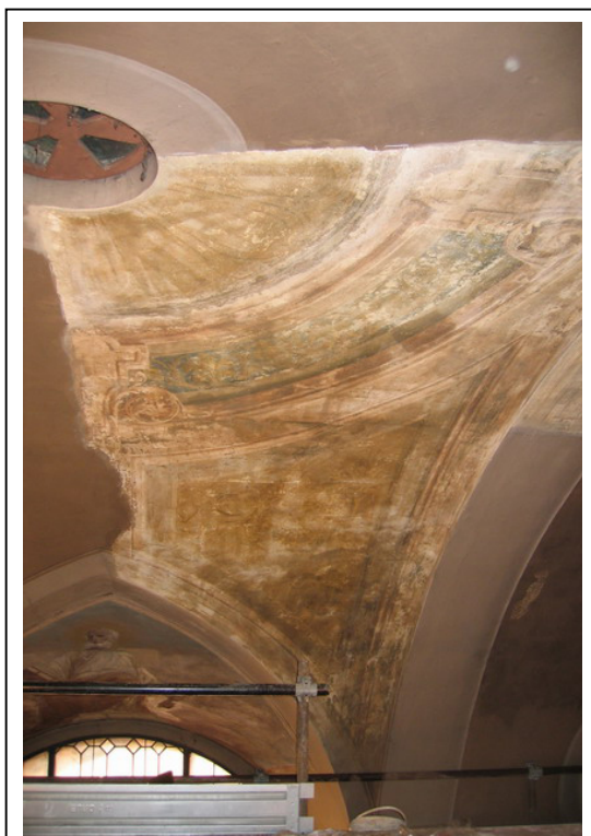
Particolare dopo disialbo