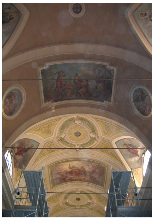
Navata centrale Ante restauro Post restauro