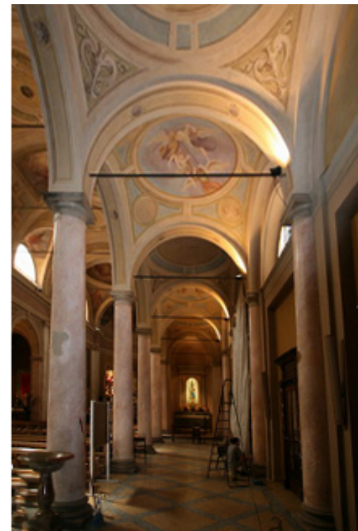
Navatella destra Post restauro