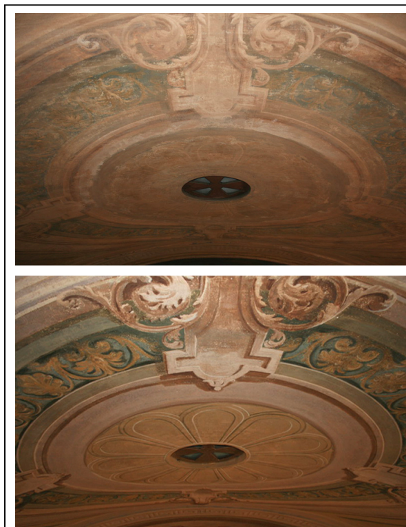
Particolare dopo il ritocco integrativo