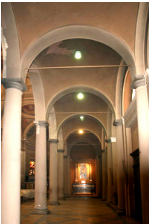
Navatella destra Ante restauro

-pulitura con AB 57 per togliere lo strato di polvere più aggregato e risciacquo con acqua